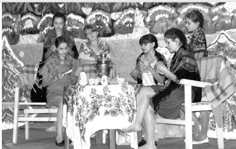
Концертная программа "Свет рождественской звезды".

Для старшеклассников и приехавших на каникулы студентов тоже проводились всевозможные шоу-программы и дискотеки. Кстати, в этом году впервые на моей памяти дискотека для школь-