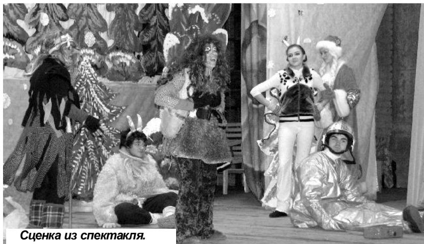
Сценка из спектакля.