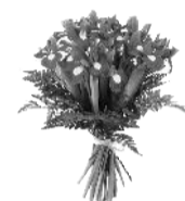
Жена и дети.

Года идут, а ты все тот же, в твоей душе покоя нет. И, глядя на тебя, не скажешь, что позади уж столько лет. И пусть здоровье будет крепким, а сердце вечно молодым, Пусть каждый день твой будет светлым На радость нам и всем родным. Желаем просто от души Здоровья, счастья, доброты, Не помни горестей и бед, Живи счастливо до ста лет!