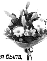
Любящие тебя родные.

Папочка, прими от нас, детей, поздравленья в славный юбилей. Семьдесят - для всех немалый срок, Но хотим, чтоб ты и дальше мог Радовать присутствием своим. Знаешь ведь, как дорог нам, любим. Как нам нужен ласковый твой взгляд, Юмор твой - ты им всегда богат, Мудрые, от сердца, наставленья. В юбилейный, славный день рожденья Радости желаем и добра, чтобы жизнь нескучная была, Чтобы хворь не мучила тебя. Не болела бы за нас душа. Был в отличном, бодром настроеньи, Как сегодня, в славный день рожденья!