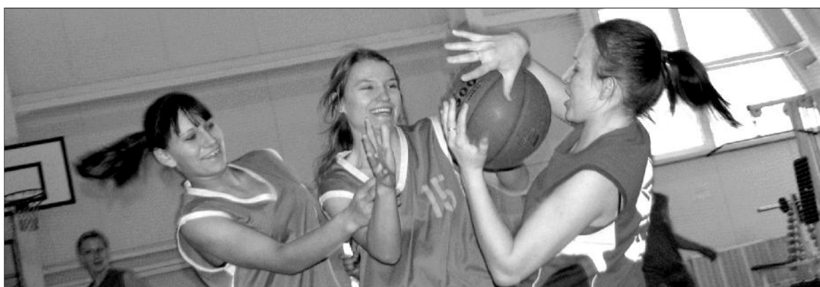
Хвастовичи. ФОК. 6 января 2012 года.