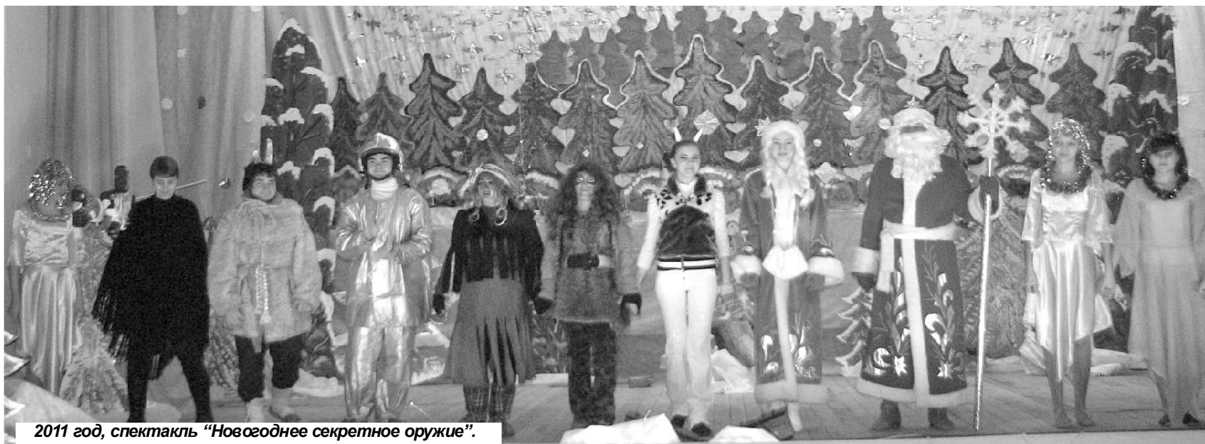
2011 год, спектакль "Новогоднее секретное оружие".