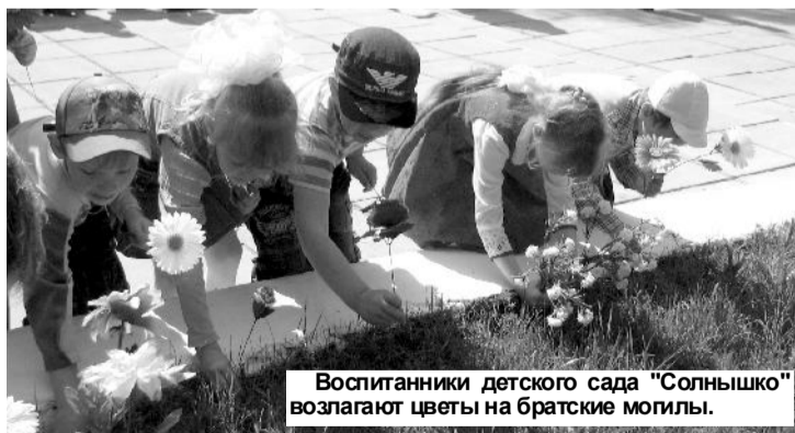
Воспитанники детского сада "Солнышко" возлагают цветы на братские могилы.

Торжественные мероприятия, посвященные празднованию Дня Победы - 9 Мая, в которых принимали участие и дети, и взрослые, повсеместно прошли на территории МР "Хвастовичский район".