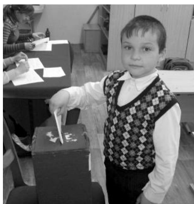
Идет голосование в МОУ "Пеневичская основная школа".

А немногим раньше, в конце апреля, в рамках областной акции "Единый день выборов в органы ученического самоуправления" с целью формирования активной гражданской позиции молодых граждан РФ и повышения интереса подрастающего поколе-