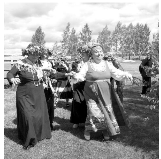
Наш корр.

С началом лета всех присутствующих на празднике поздравил глава администрации СП "Село Хвастовичи" В. С. Богачев, свои выступления на протяжении всей концертной программы дарил ансамбль "Рябинушка", хор ветеранов "Вдохновение". И, конечно, огромное спасибо за организацию этого праздника работникам районного Дома культуры и спонсору праздника - администрации МР "Хвастовичский район".