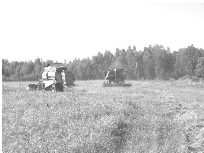
Текст и фото Василия ИВАНОВА.

На 3 августа в сельхозкооперативе было обмолочено 200 гектаров зерновых, собрано урожая 300 тонн.