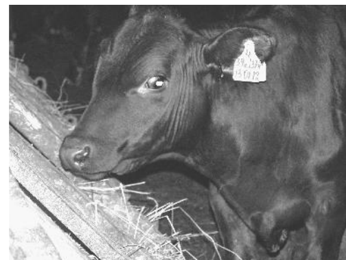
Шестимесячный бычок абердин-ангусской породы, родившийся на бояновичской ферме.

хорошо. А главное - растут, пусть не по часам, но по дням заметно. От роду им по полгода, а они уже весят до 200 кг, хотя на вид столько и не дашь. Как говорится, порода своё берёт.