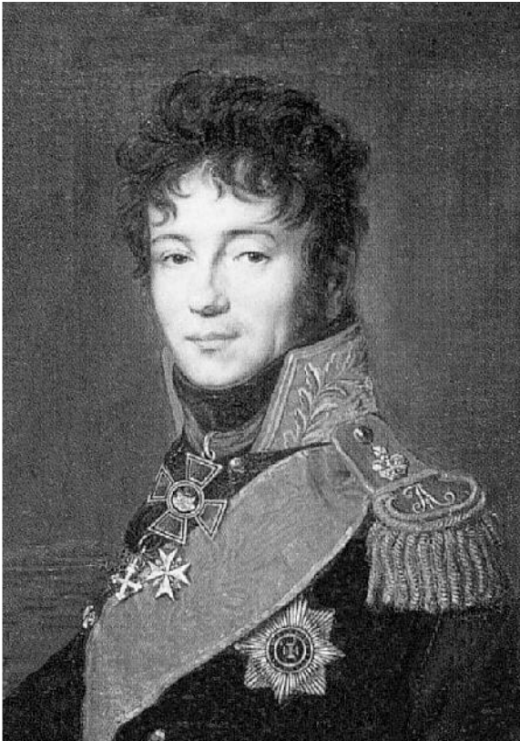
Граф генерал-адъютант Евграф Федотович Комаровский.