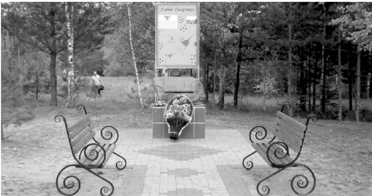
Мемориал на территории усадьбы Комаровская недалеко от д. Буки и ручья Громовой, открытый 2.06.2012 года.

ему не только потерей карьеры, но и судом.