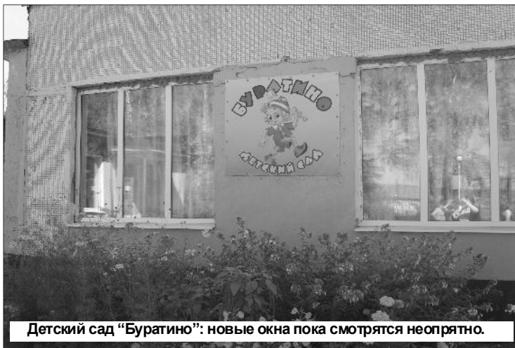
Детский сад "Буратино": новые окна пока смотрятся неопрятно.

оборудованием. Введена должность педагога-библиотекаря. Оборудован медкабинет. В зубном кабинете новое современнейшее стоматологическое оборудование и кресло. В столовую закуплена новая посуда. Школа получила еще 8 ком-