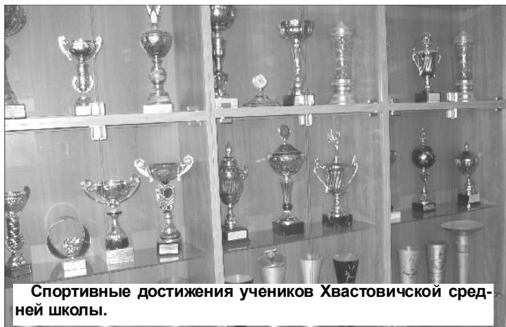
Спортивные достижения учеников Хвастовичской средней школы.

Детский сад "Тополёк" . Наши ясельки, без которых нам никак не обойтись. Они должны быть тёплыми, красивыми, с просторными светлыми "груп-