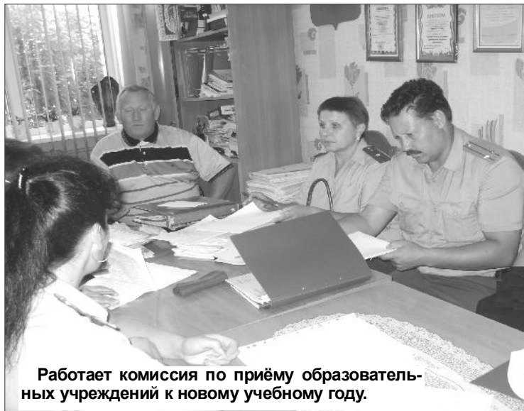
Работает комиссия по приёму образовательных учреждений к новому учебному году.