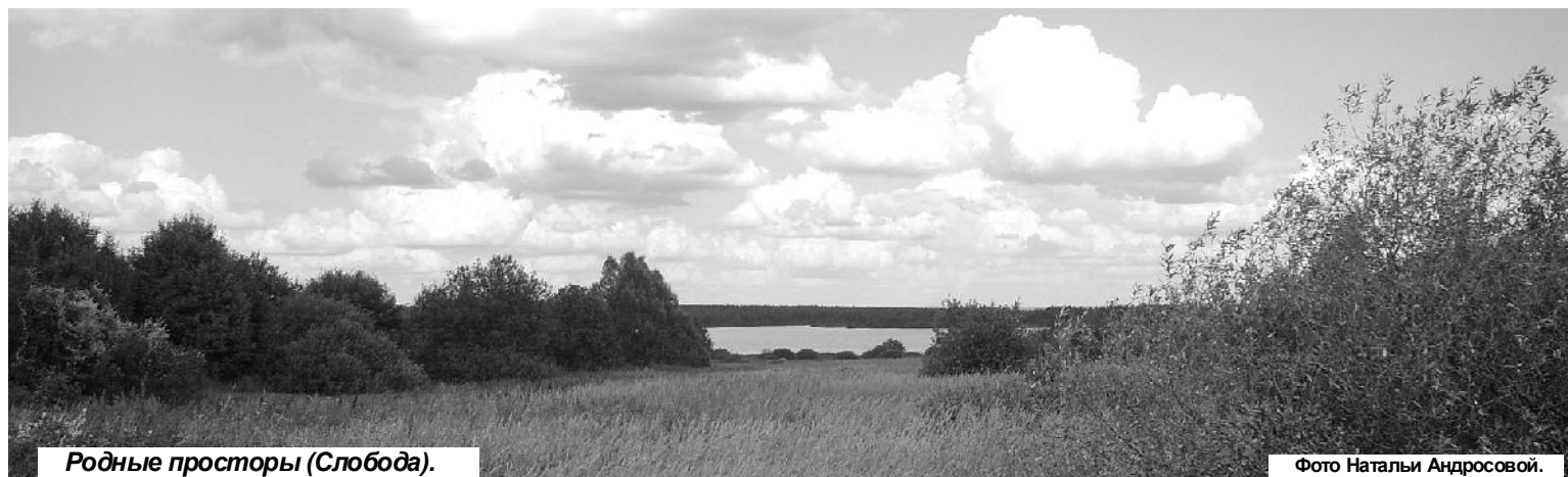
Родные просторы (Слобода).