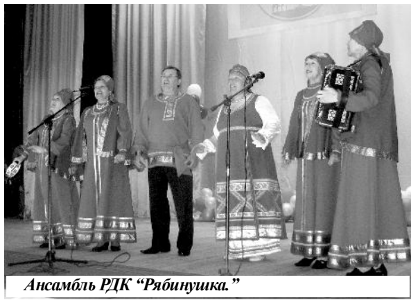
Ансамбль РДК "Рябинушка."

но быть самоцелью, а лишь средством для повышения качества образования.