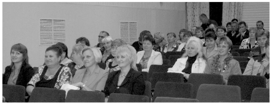
ГРАФИК ПРИЁМА ГРАЖДАН

в общественной приёмной местного отделения партии «Единая Россия» Хвастовичского района на сентябрь 2012 года