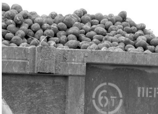
Урожай впервые применённого сорта картофеля "Розалинт". Сортосмена значит многое!