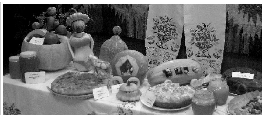
Жаль, что не все сельские поселения района приняли участие в ярмарке. Подбужане, как обычно, достойно представили своё село.