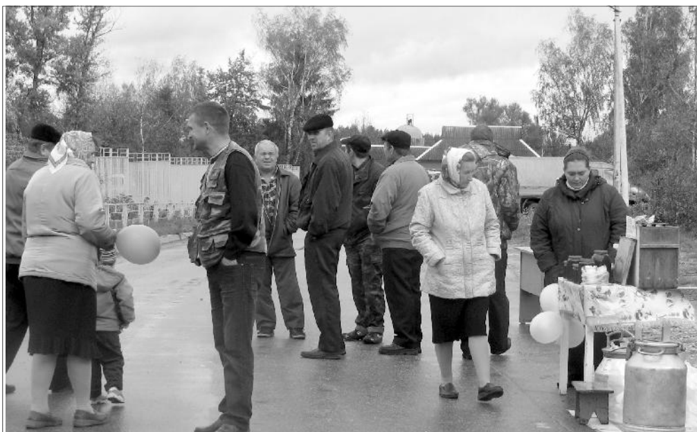
Ярмарка закончилась, но расходиться по домам не хочется. Когда еще доведётся встретиться?