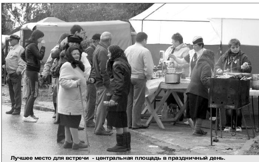
Лучшее место для встречи - центральная площадь в праздничный день.