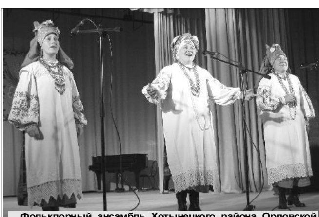
Фольклорный ансамбль Хотынецкого района Орловской области "Калинов садок".