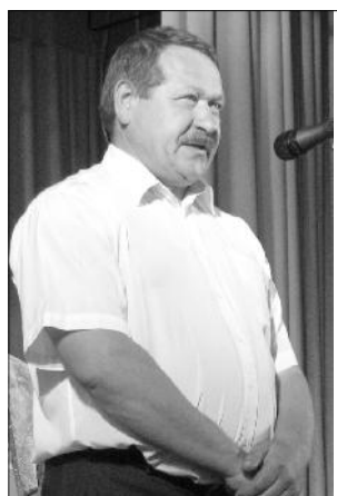
Глава администрации СП "Село Красное" приветствует односельчан и гостей села.