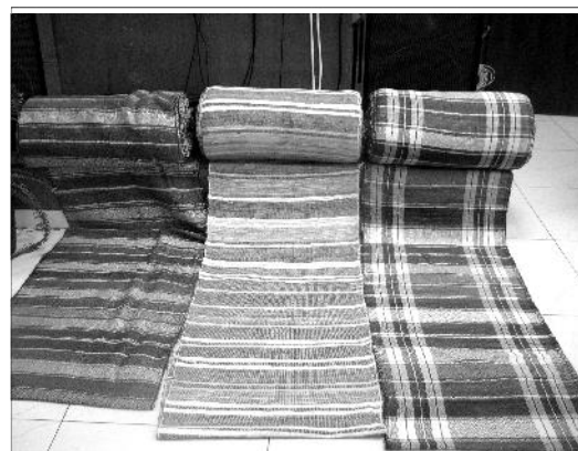
Не зря красненские половики славятся на всю округу. Гости ярмарки лично убедились в этом.