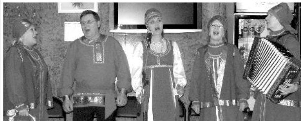
Ансамбль "Рябинушка" порадовал юбиляров музыкальным подарком.

Праздник закончился и верстаётся свежий номер газеты. Наша жизнь идёт своим чередом. Но, какие бы порою страсти ни разгорались в нашей редакции, мы знаем, что всё это не напрасно. Нас читают, нам доверяют, ждут каждый номер нашей газеты наши читатели. И за это СПАСИБО!