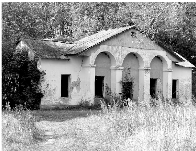
Здание бывшего клуба.