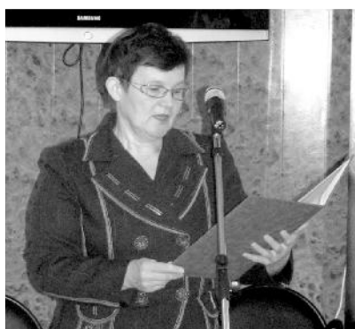
Представитель управления по работе со СМИ администрации губернатора Т. М. Захарова зачитывает поздравительный адрес губернатора.