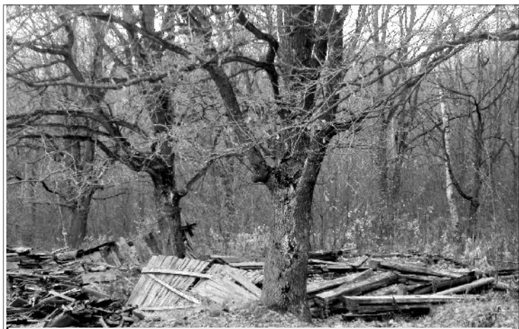
А это окраина улицы Лесной. Это место издавна славится запущенностью и неухоженностью. Возможно, кое-кто из жителей близлежащих домов узнает свои дрова и строительные материалы, которые за долгое время, что провели в лесном массиве, постепенно превратились в обычный хлам. А там и без него хватает мусора - банки, бутылки, пакеты, ржавые ведра и многие другие "прелести". Очень жаль, что это место до сих пор не стало зоной отдыха, местом чистым и ухоженным, дарящим только положительные эмоции.

созданных администрациями сельских поселений. Например, проблемный вопрос - парковка автомобилей. Особенно возле многоквартирных домов. Но многое зависит и от самих жителей. Часто мы забываем о том, что санитарный час по пятницам никто не отменял.