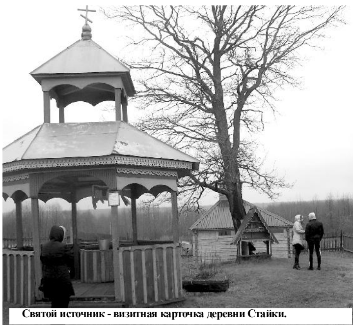
Святой источник - визитная карточка деревни Стайки.

21 ноября - День работника налоговых органов