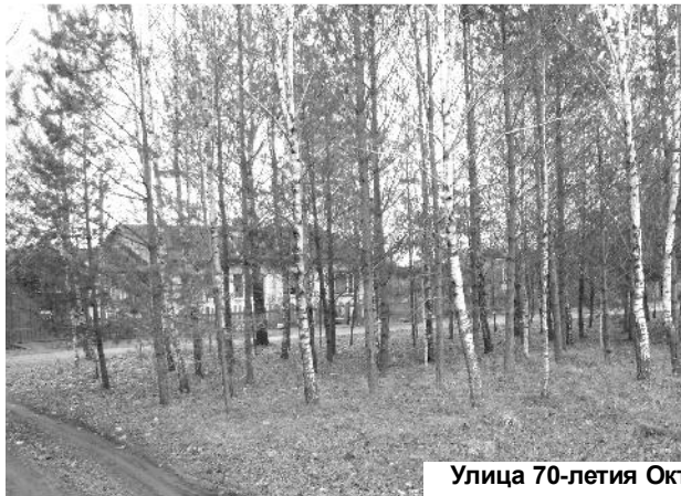
Улица 70-летия Октября - сказочное место.