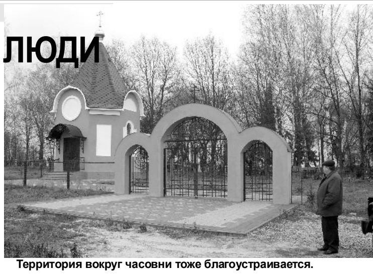
Территория вокруг часовни тоже благоустраивается.