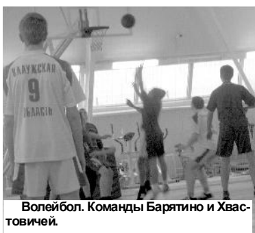
Волейбол. Команды Барятино и Хвостовичей.

5-6 НОЯБРЯ в г. Людиново прошёл чемпионат по волейболу среди юниоров. В соревнованиях уча-