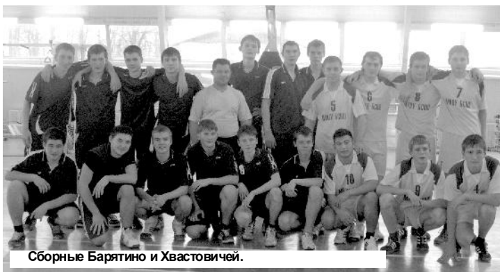
Сборные Барятино и Хвостовичей.

16-17 НОЯБРЯ начались отборочные игры по баскетболу, 66-я спартакиада Калужской области.