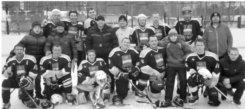
Сборная Хвастовичского района по хоккею.

Елена ПАРШИКОВА.