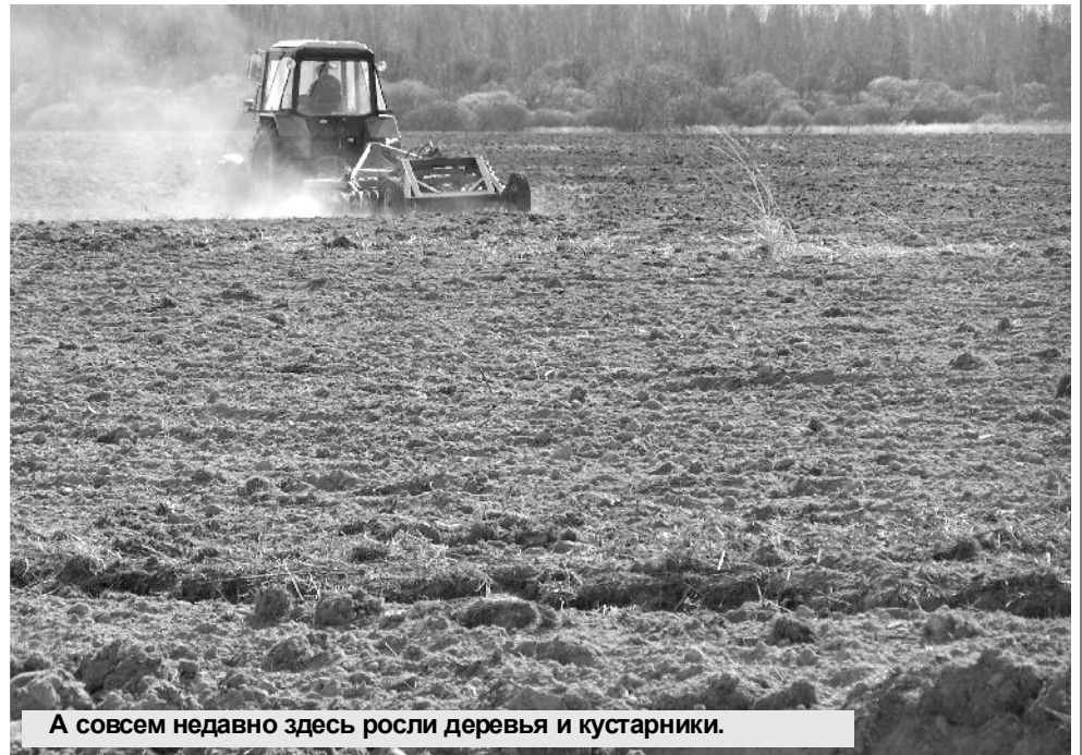
А совсем недавно здесь росли деревья и кустарники.