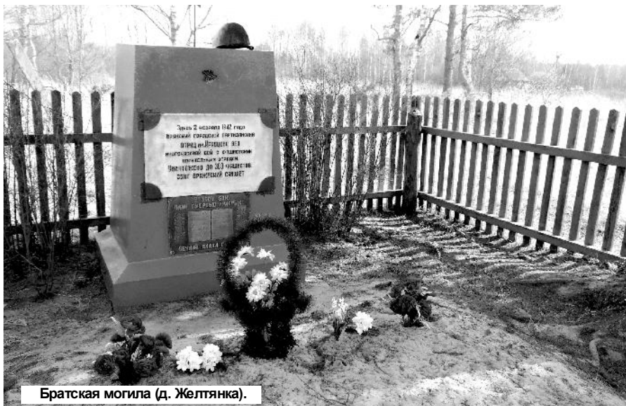
Братская могила (д. Желтянка).

В рамках подготовки к празднованию Великого дня Победы мы продолжаем объезжать отдалённые населённые пункты с целью ознакомления с местами Братских захоронений, памятниками воинам-освободителям, мемориалами.