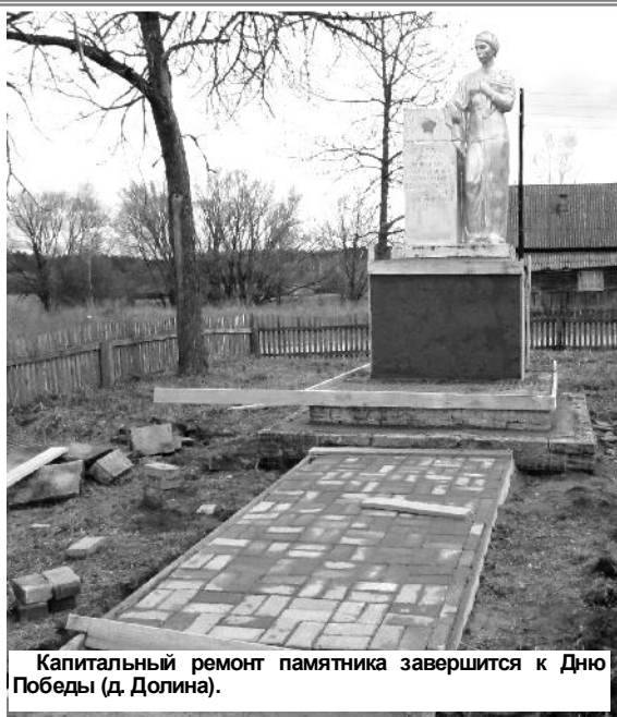
Капитальный ремонт памятника завершится к Дню Победы (д. Долина).

Наталья АНДРОСОВА.