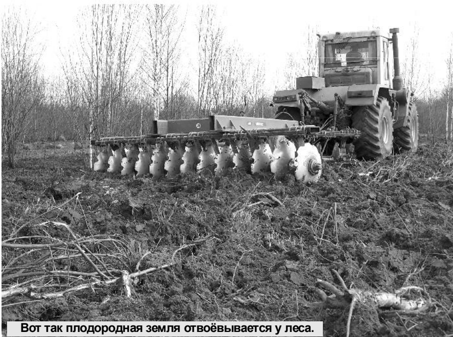
Вот так плодородная земля отвоёвывается у леса.