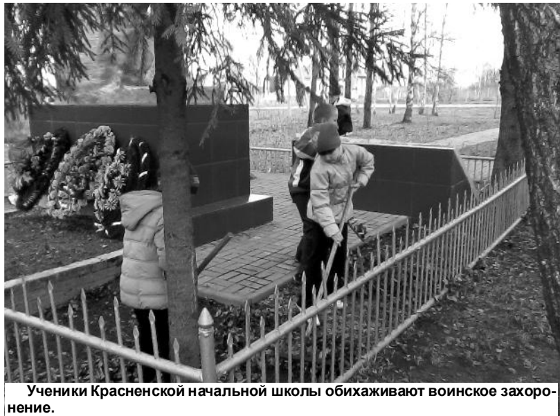
Ученики Красненской начальной школы обихаживают воинское захоронение.

Самое активное участие в акции приняли школьники района. Их силами практически в каждом населённом пункте разбиты аллеи Победы. Но не только посадкой деревьев занимались школьники этой весной. Уборка своих пришкольных территорий и населённых пунктов, содержание в поряд-