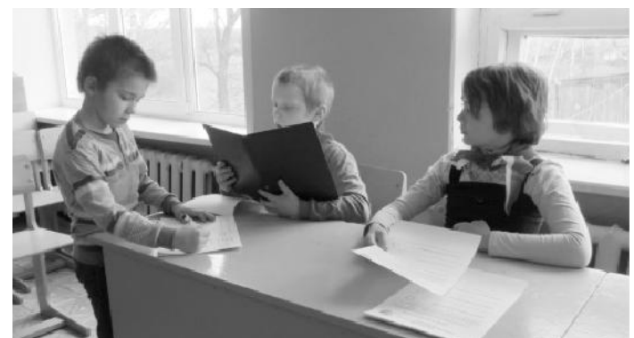
Избирательная комиссия МОУ "Колодясская начальная школа" за работой.