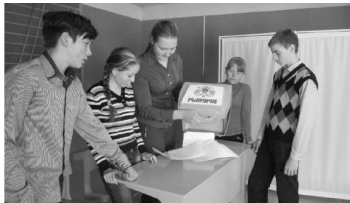
Подсчёт голосов в МОУ "Подбужская средняя школа".