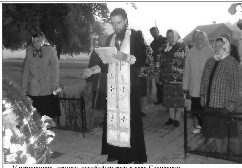
У памятника воинам-освободителям в селе Бояновичи.