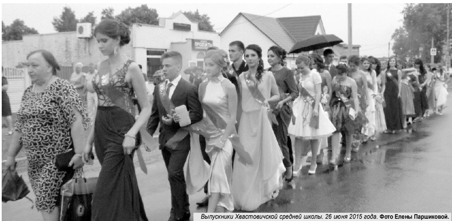
Выпускники Хвастовичской средней школы. 26 июня 2015 года.

До свиданья, детство! Школа, до свиданья! Поднят парус знаний, Выверен маршрут К берегам далёким Истинных призваний! Первые открытия Впереди нас ждут. Пролетели годы незаметно. До свиданья, школа, навсегда! Знай же, выпускник, минуту расставанья эту Ты забыть не сможешь никогда! Воплотить мечту свою старайся И в большую жизнь скорей иди! В дружбу верь, в себе не сомневайся - Ждут успех и счастье впереди!