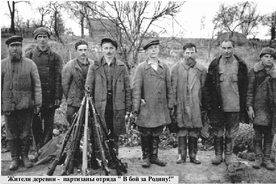
Жители деревни - партизаны отряда "В бой за Родину!"

В октябре 1941 года моя родная деревня Терёбень была оккупирована немцами, которые зверски издевались над