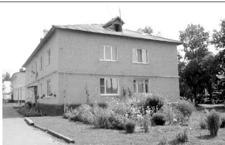
Неоднократный победитель конкурса - многоквартирный дом № 5 по улице Ленина.

Наведение красоты и чистоты - дело заразительное, потому преображаются не только дома, но и предприятия и учреждения райцентра. Силами работников разбиваются клумбы, высаживаются цветы, содержится в чистоте прилегающая территория. И также, как и в жилом секторе, всё сложнее выбрать победителей конкурса, всё большее ко-