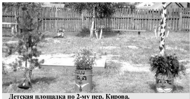
Детская площадка по 2-му пер. Кирова.