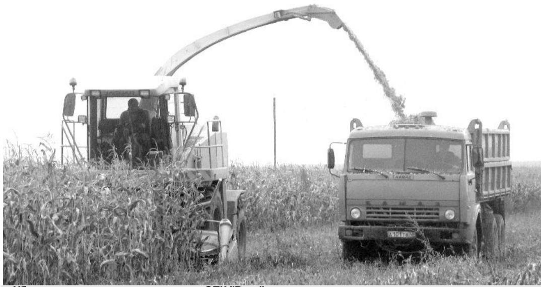
Уборка кукурузы на силос на полях СПК "Русь".