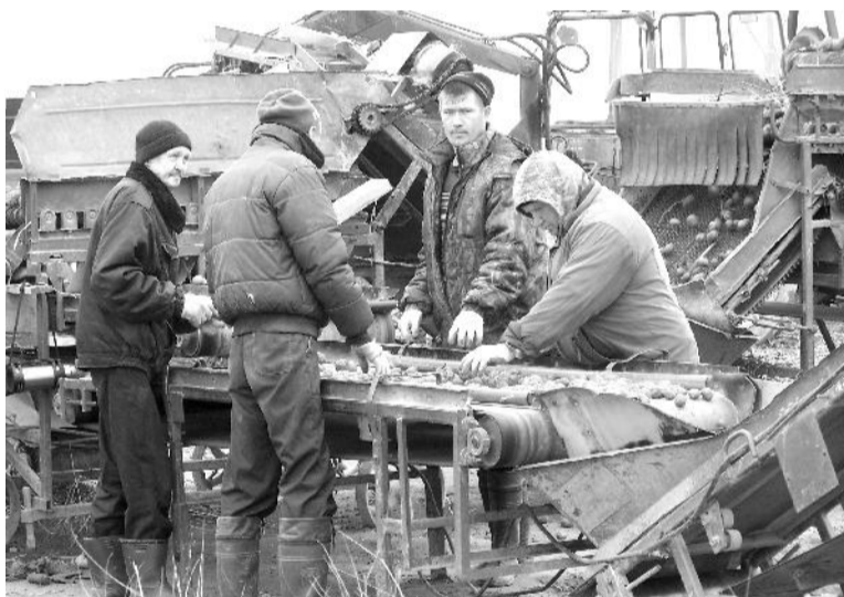
На картофелесортировочном пункте СПК имени Карла Маркса.