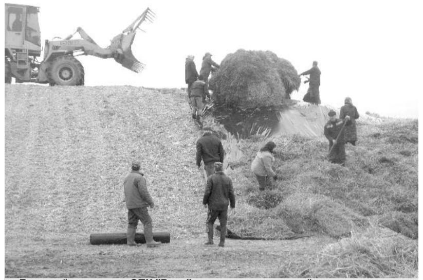
Дружный коллектив СПК "Русь" на закладке силосной траншеи.

Сентябрь. Напряжённый ритм работы на полях сельскохозяйственных предприятий района не снижается. Одной из главных задач, стоящих перед СПК и СХА сегодня - осенний сев. Залог будущего урожая - это успех предстоящего года, и об этом знает каждый из земледельцев, поэтому и результат сложной работы налицо.