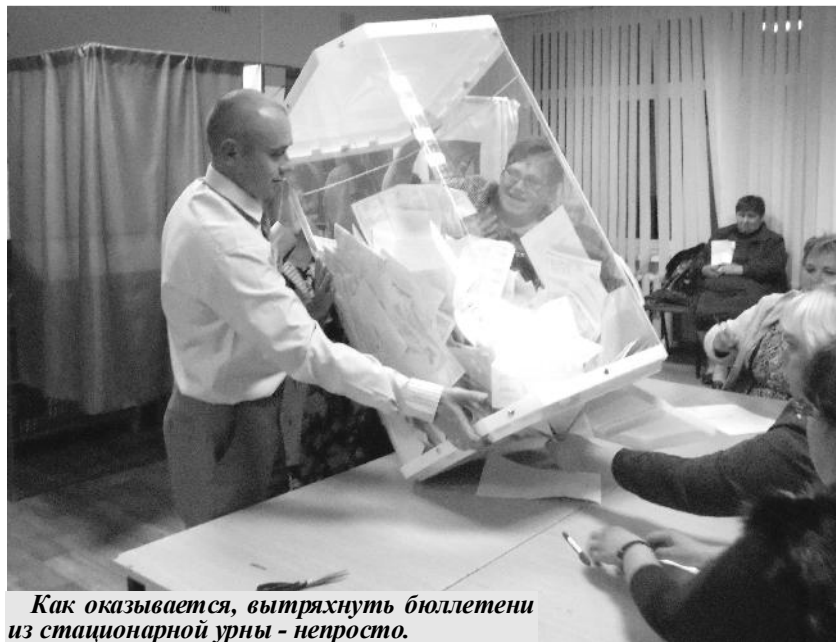
Как оказывается, вытряхнуть бюллетени из стационарной урны - непросто.