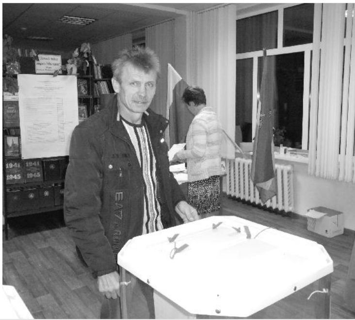
Последний избиратель на участке № 2716.