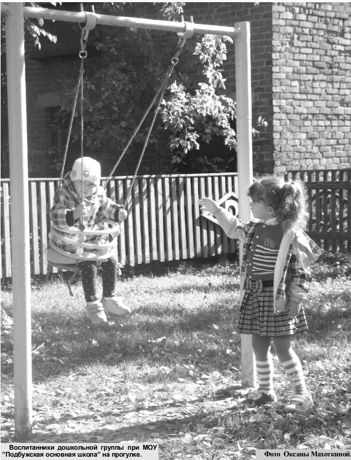
Воспитанники дошкольной группы при МОУ "Подбужская основная школа" на прогулке.