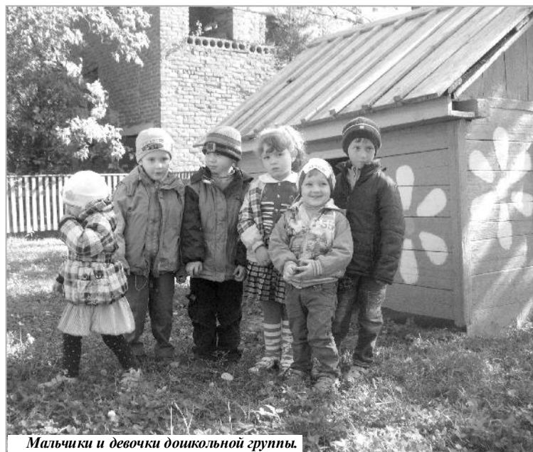
Мальчики и девочки дошкольной группы.