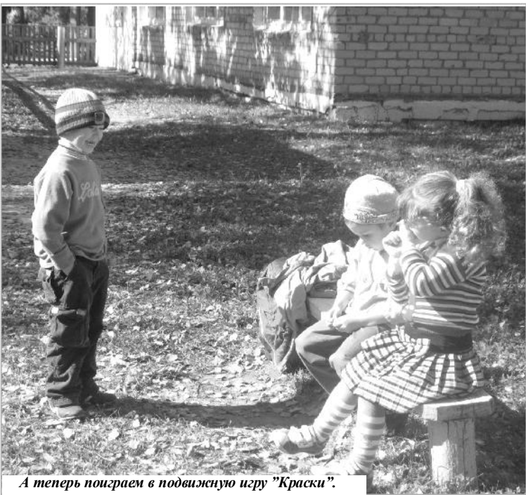
А теперь поиграем в подвижную игру "Краски".