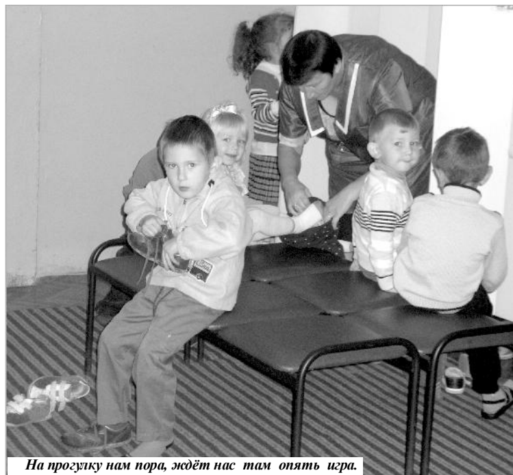
На прогулку нам пора, ждёт нас там опять игра.