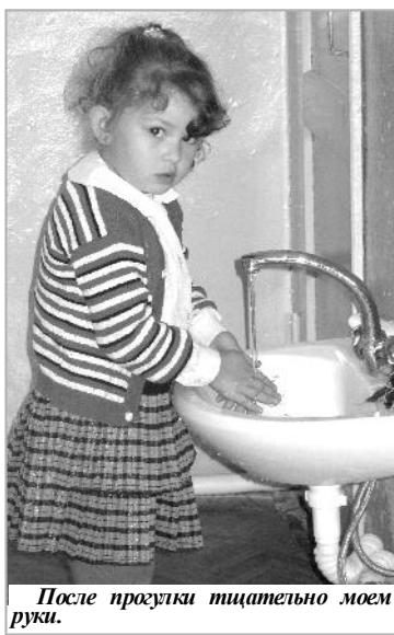
После прогулки тщательно моем руки.