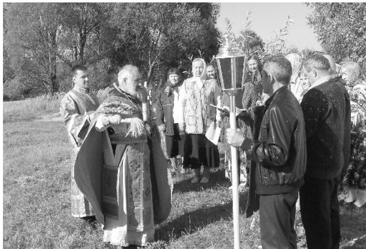
Молитва батюшки о скорейшем завершении строительства храма.