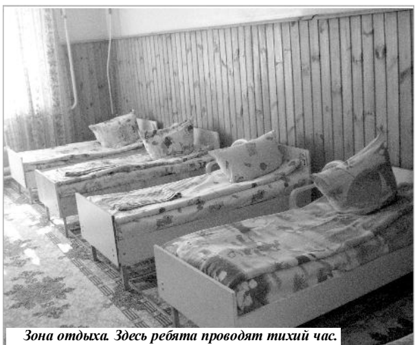
Зона отдыха. Здесь ребята проводят тихий час.