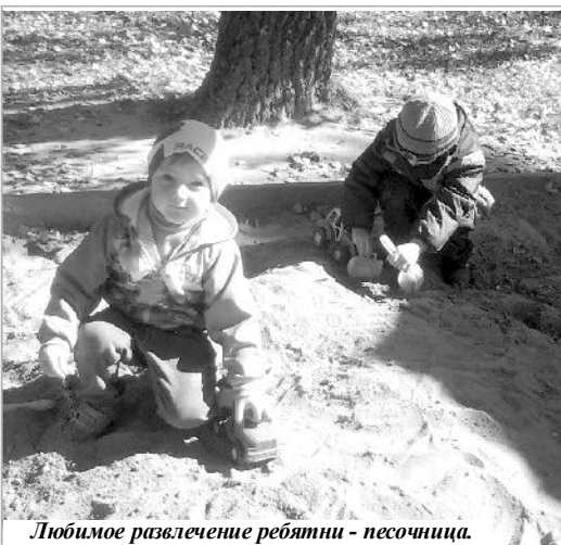
Любимое развлечение ребятни - песочница.