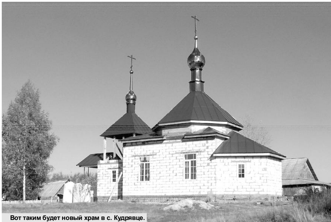
Вот таким будет новый храм в с. Кудрявце.