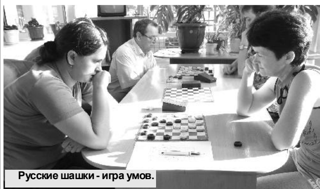
Русские шашки - игра умов.

25 сентября 2015 года под громкую весёлую музыку в ФОК входили люди в спортивной форме: первой Спартакиады среди работников администраций сельских поселений и МР "Хвастовичский район" открывалась традиционная "Неделя здоровья".