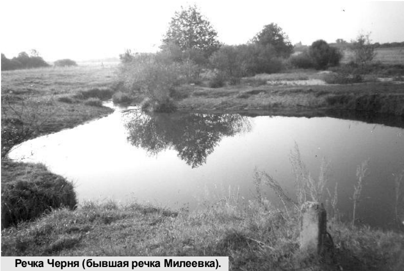
Речка Черня (бывшая речка Милеевка).

В 1920-е годы при укрупнении волостей к Милеевской волости были присоединены соседние Кцынская и Теребенская волости. Население укрупнённой Милеев-