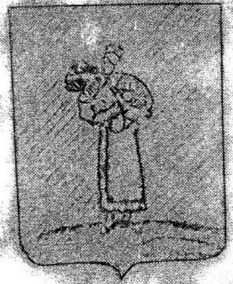
Герб села Милеево.

Герб символи- зирует то, что жители сих мест издревле занима- лись земледели- ем и через то надежду и достаток имели