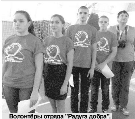
Волонтеры отряда "Радуга добра".