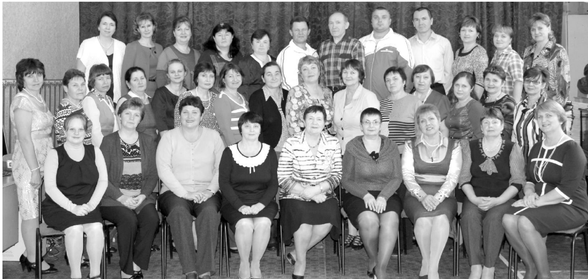
Педагогический коллектив Хвастовичской средней школы - сегодня самый большой в районе. В его составе 48 педагогических работников.