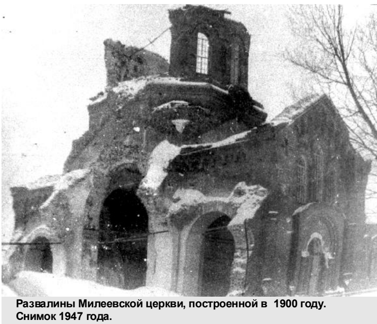
Развалины Милеевской церкви, построенной в 1900 году. Снимок 1947 года.

(Продолжение - в следующих номерах газеты "Родной край").