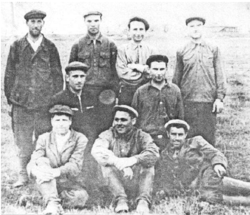
Плотническая бригада колхоза "Заветы Ильича", 1957 год.

В конце 40-х годов на берегу реки Черня работал молокозавод (территория старого тракторного стана). Молоко принималось от коров колхозов и коров сельчан из населённых пунктов Гривы, Мокрых Дворов, Ресеты, Ловатянки, Харитоновки, Фалеевки, Колодясс, Абрамовского, Павловки, Новосёлки, Красного. Полученную продукцию -