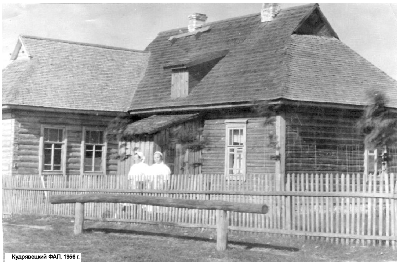
Кудрявецкий ФАП, 1956 г.

Учредители: Администрация муниципального образования "Хвостовичинский район" Калужской области, редакция газеты "Родной край".