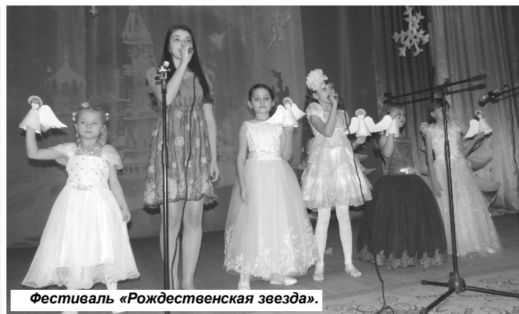
Фестиваль «Рождественская звезда».

3 и 5 января в спортивном зале посёлка прошли "Весёлые старты". Командные эстафеты, мини-футбол, конкурсы, которые проводили работники администрации, СДК и библиотеки, подарили всем участникам заряд бодрости хорошего настроения.