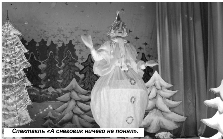
Спектакль «А снеговик ничего не понял».

Участники фестиваля представили большую интересную программу. Все номера были