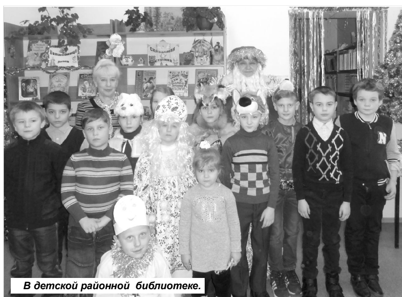
В детской районной библиотеке.