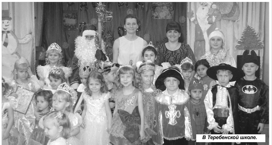
В Тербенской школе.

Участники фестиваля были награждены Благодарственными письмами, а также всех