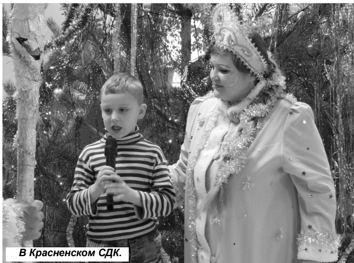
В Красненском СДК.

Совет родителей и администрация МКОУ "Еленская сред-