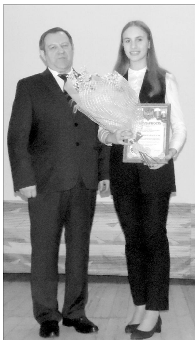
Спортивная жизнь в районе тоже не стоит на месте. В 2017 году было проведено 150 спортивно-массовых ме-

роприятий, 142 человека сдали нормы ГТО, 11 человек получили Знак отличия. К этой планке надо стремиться всем!