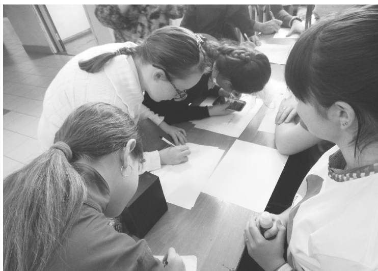
Волонтеры и ученики школы участвуют во Всероссийском проекте «Моя история», в рамках которого нужно изобразить свою родословную в виде генеалогического дерева.

2017-2018 учебном году входит 23 обучающихся 8-11 классов. Слово "Волонтер" в переводе с французского означает "доб-