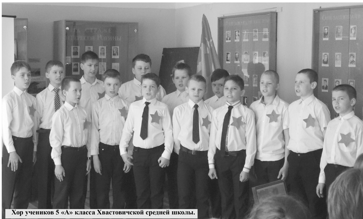
Хор учеников 5 «А» класса Хвастовичской средней школы.

Губернатор Калужской области А. Д. АРТАМОНОВ.