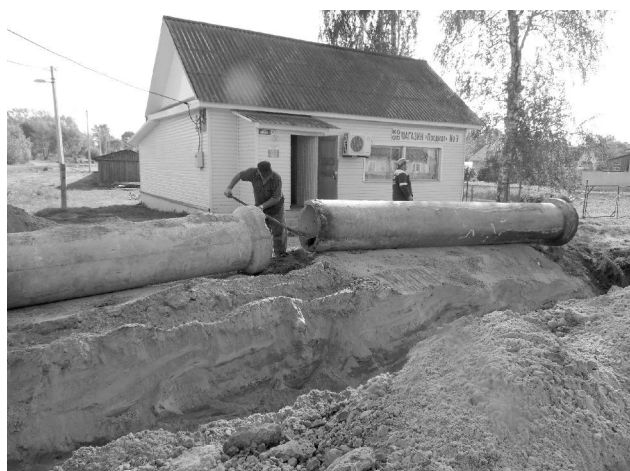
Рабочие "ПМК-9" проводят демонтаж водопроводной трубы на улице Кирова.