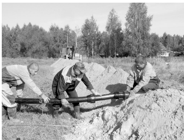
Работники Хвастовичского участка Облводоканала завершают замену водопровода на улице Димитрова.

Выделенные средства активно используются для решения проблем водоснабжения жителей районов. Например, в селе Паликский Думиничского района ведутся работы по замене канализации, в Сухиничском районе финансовые средства направлены на ремонт водопроводных сетей в пос. Середнейск, в деревне Акимовка Жиздринского района проводится ремонт водопровода. Завершаются ремонтные работы и в райцентре Хвастовичи.