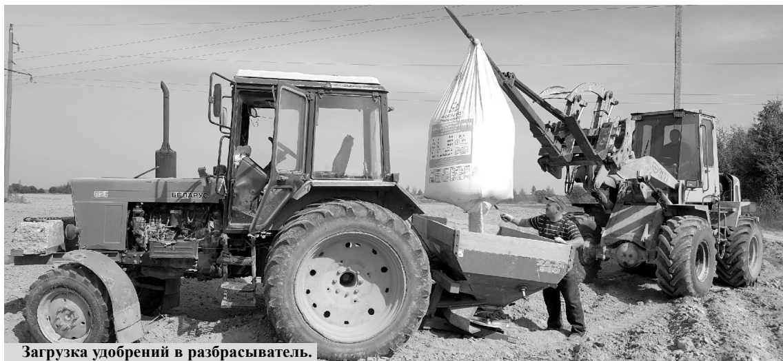
Загрузка удобрений в разбрасыватель.