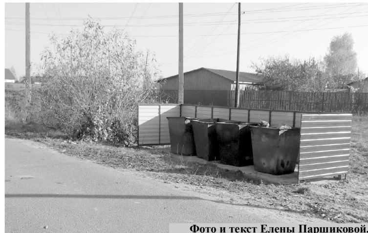
Фото и текст Елены Паршиковой.