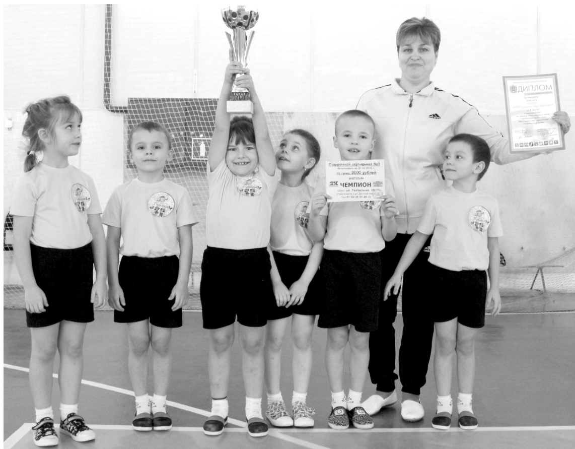
Команда-победитель Спартакиады - "Лучики" (Хвастовичский район).

Маленькие спортсмены и их воспитатели волновались не на шутку - всё-таки, областные соревнования. У многих малышей соревнования подобного уровня были первыми в жизни. Но уже после первого конкурса "Приветствие" волнение сменилось настоящим спортивным азартом, и к первому спортивному испытанию - эстафете на 30 метров - все девочки и мальчики подошли с нескрываемым желанием победить и обыграть соперников. Уже на этом этапе выделились два лидера: "Лучики" и "Ягодка". Борьба между ними развернулась нешуточная: эстафету хвастовичские и думиничские ребята прошли за одинаковое время, не уступив сопернику ни одной секунды. Ненамного отстали от них и остальные участники Спартакиады.