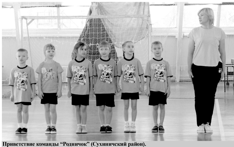
Приветствие команды "Родничок" (Сухиничский район).