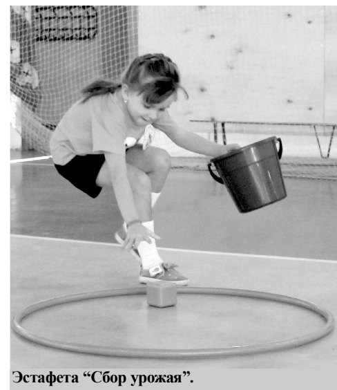
Эстафета "Сбор урожая".

Четвёртый этап - "Змейка" - включал в себя прыжки с мячом, причём, как следует из на-