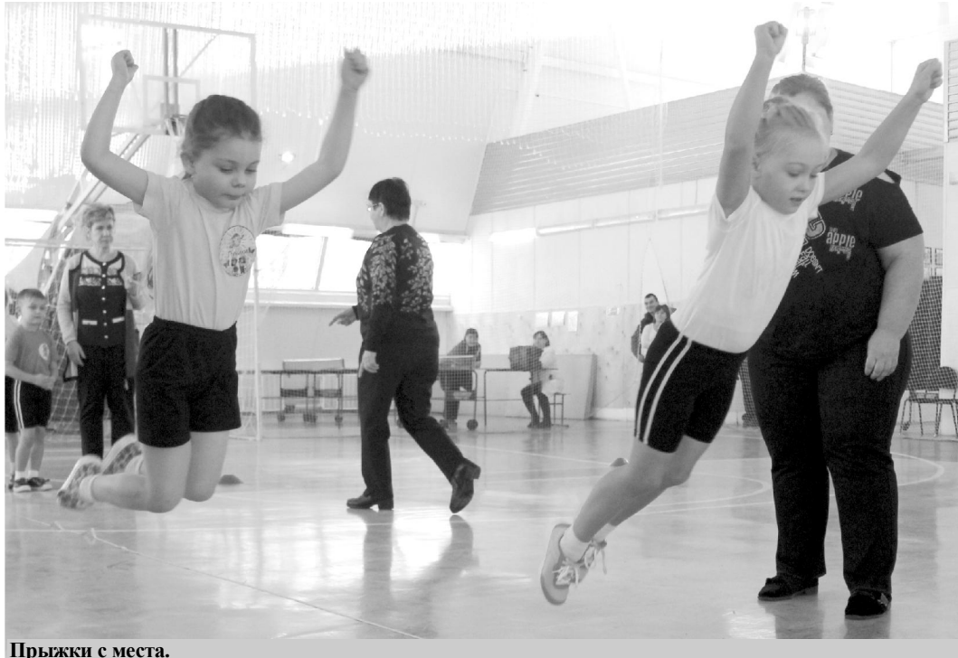
Прыжки с места.