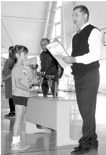
Награждение победителей. Диплом за 3-е место - команде "Кузнечики" Ульяновского района.