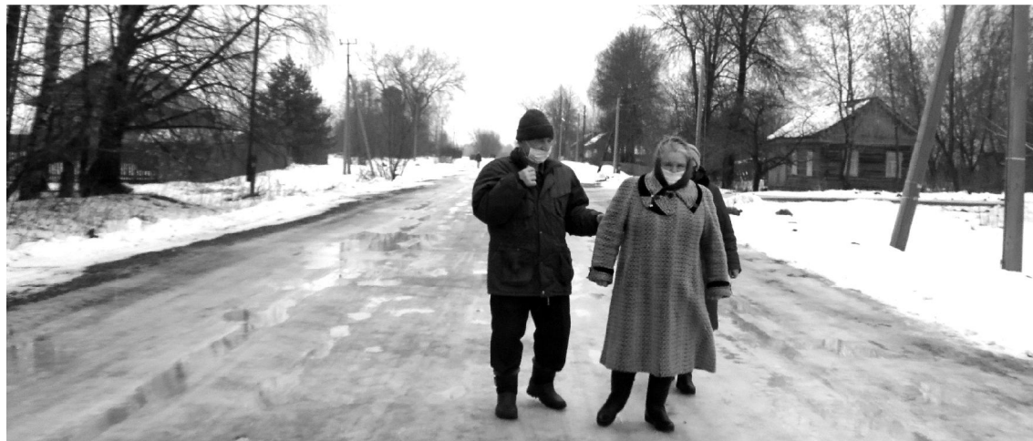
Хоть и немногочисленный по составу населения состоялся отчёт в Слободе, но работа главы признана удовлетворительной, а местные жители отметили для себя пункты, над которыми следует работать.

В Милеево жителей беспокоит уличное освещение. Слишком уж часто выходят из строя фонари, а в осенние и зимние месяцы их своевременная замена имеет огромное значение. Также беспокоит жителей и гражданское кладбище - очень много там старых деревьев, которые необходимо выпилить. "Эти работы мы решили провести по программе поддержки