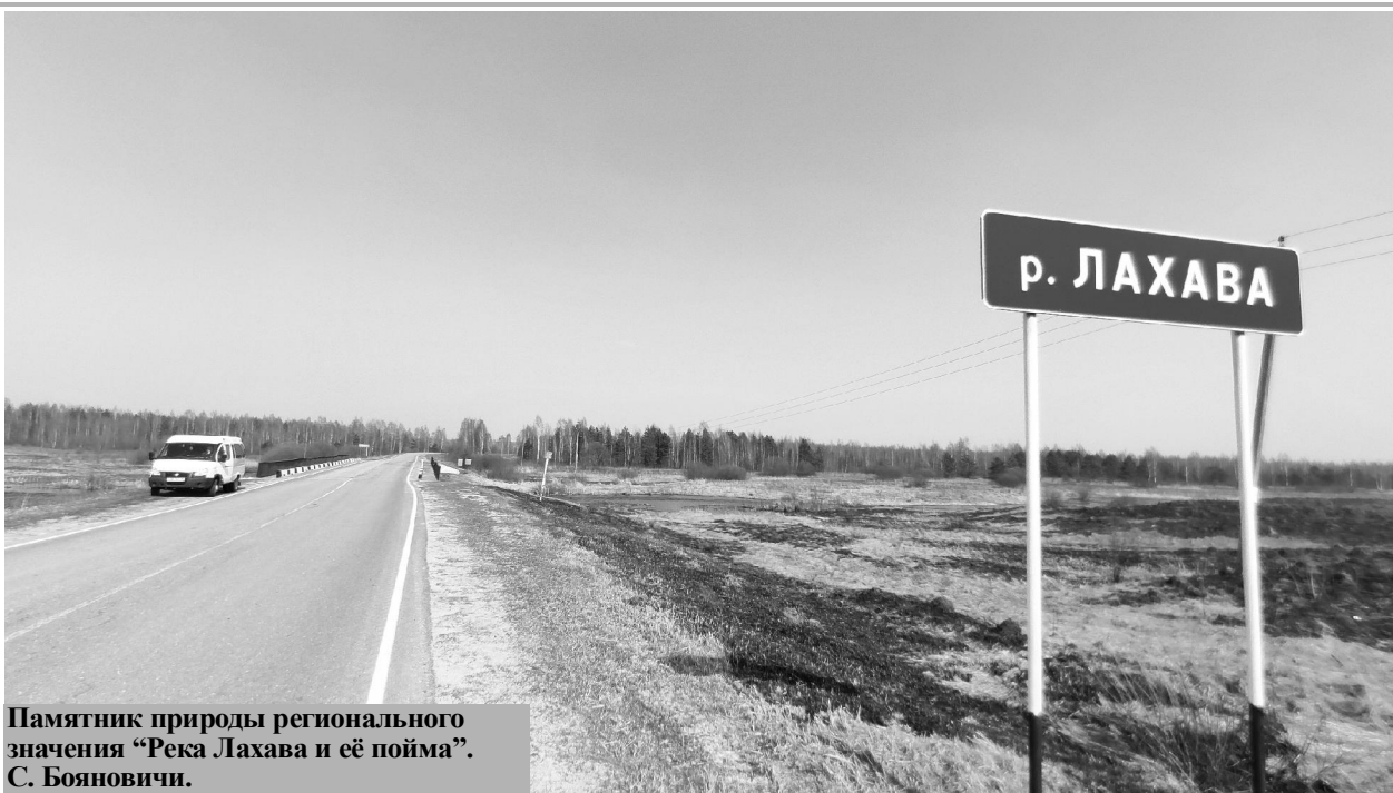
Памятник природы регионального значения "Река Лахава и её пойма". С. Бояновичи.

В Советском Союзе в 1924 году был выпущен новый указ.