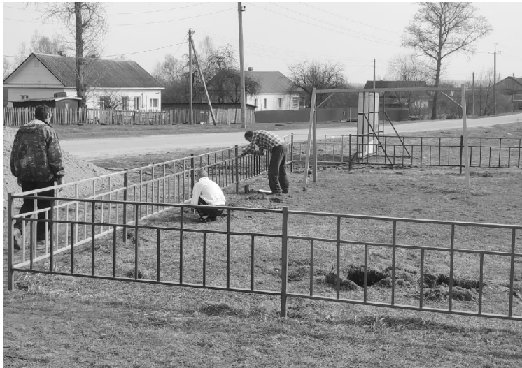
На детской площадке по улице Гагарина уже ведутся ремонтные работы.

В наступающем благоустроительном сезоне в районном центре в рамках реализации программы появится ещё одна детская площадка - на этот раз на улице 70-летия Победы. Эта новая улица, и пока ещё она только начинает застраиваться. Но площадка будет также расположена неда-