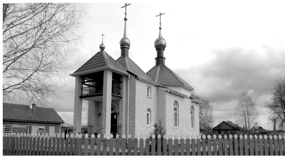
Действующий храм в честь Покрова Пресвятой Богородицы в селе Кудрявец.