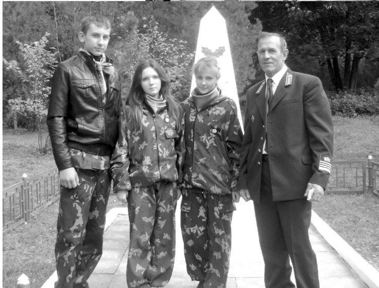
В школе создано школьное лесничество "Лесная полоса".