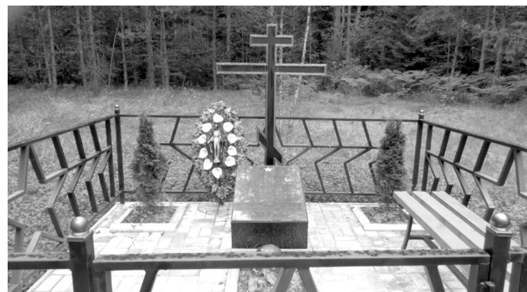
Братское захоронение - урочище Комаровское.

ревне Палькевичи. Все работы выполняет строительная фирма ООО "Партнёр" (с. Хвастовичи). Уже поставлена и прогрунтована ограда. Выложили дорожку плиткой, завезли песок.