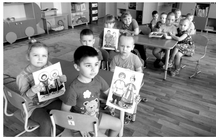
Занятие в дошкольной группе по ознакомлению с окружающим миром.