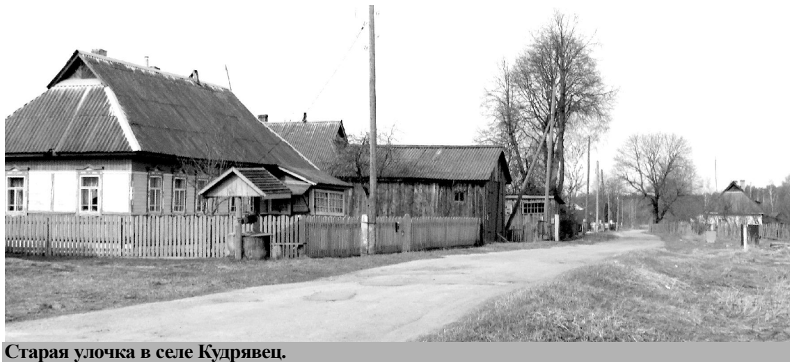
Старая улочка в селе Кудрявец.