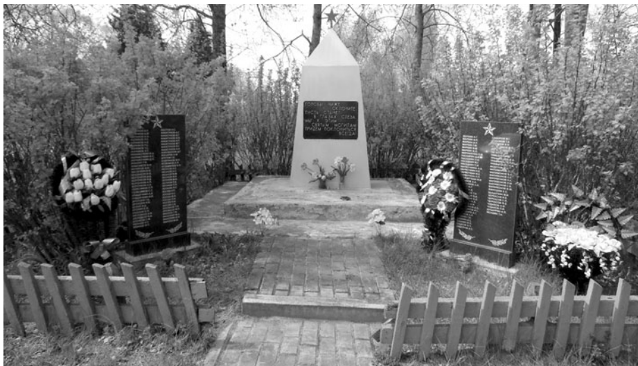
Братская могила в центре села Милеево.