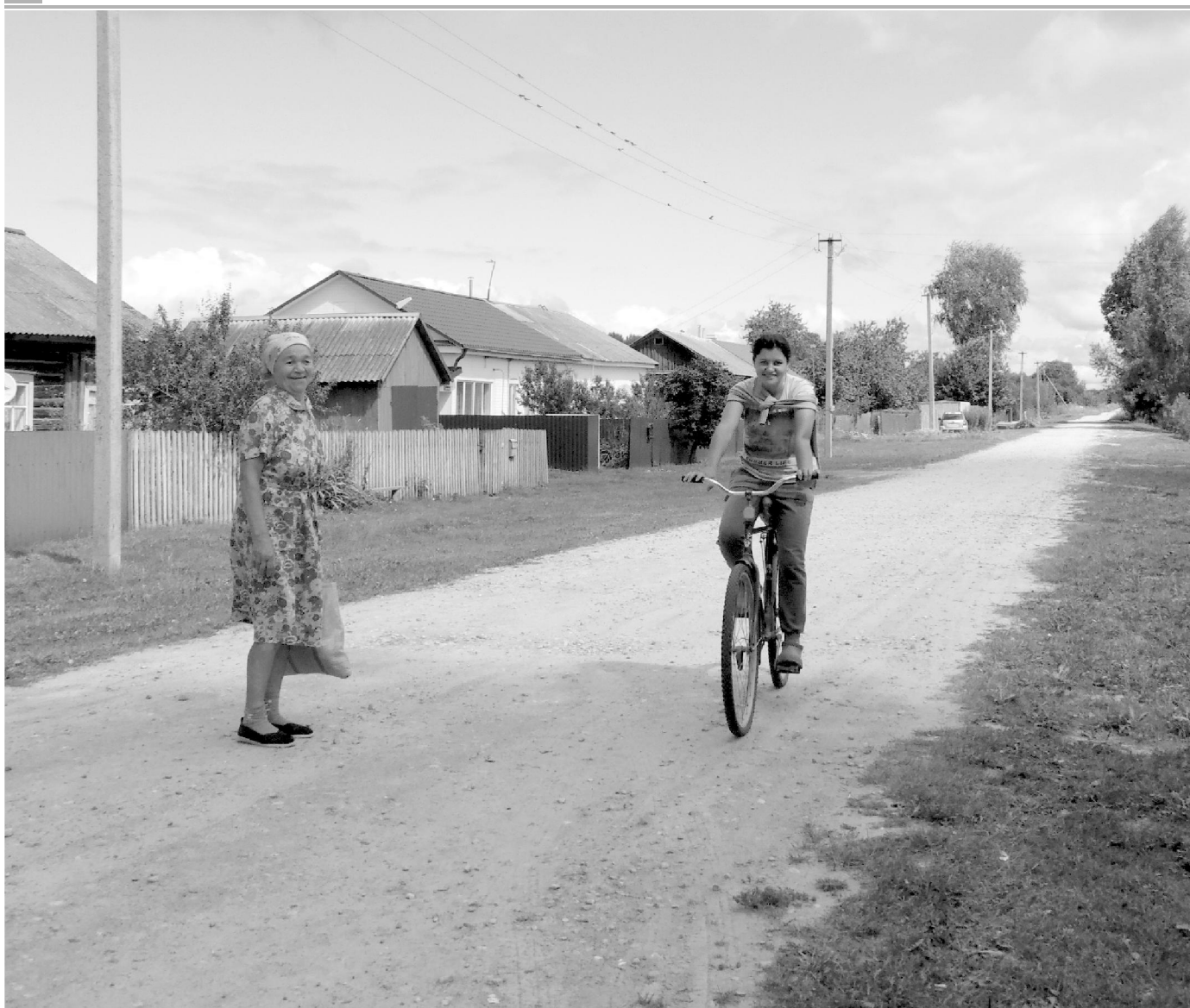
Одна из улиц села Воткина. Материал о жизни в сельском поселении читайте на 3-й странице.