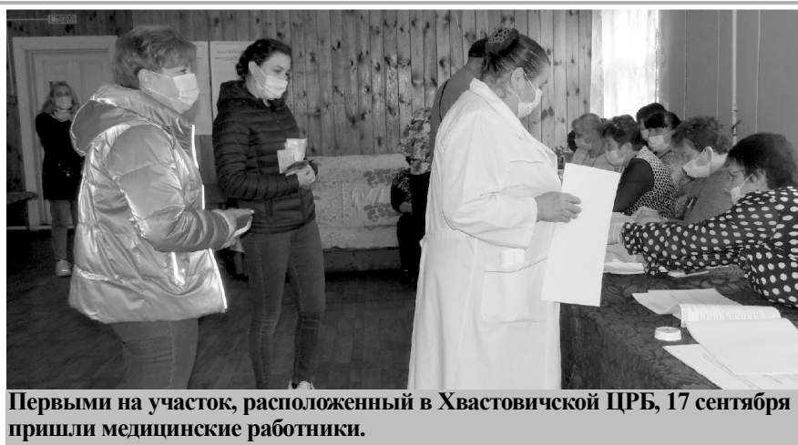
Первыми на участок, расположенный в Хвастовичской ЦРБ, 17 сентября пришли медицинские работники.

По данным ЦИК, после подсчета 25% протоколов,