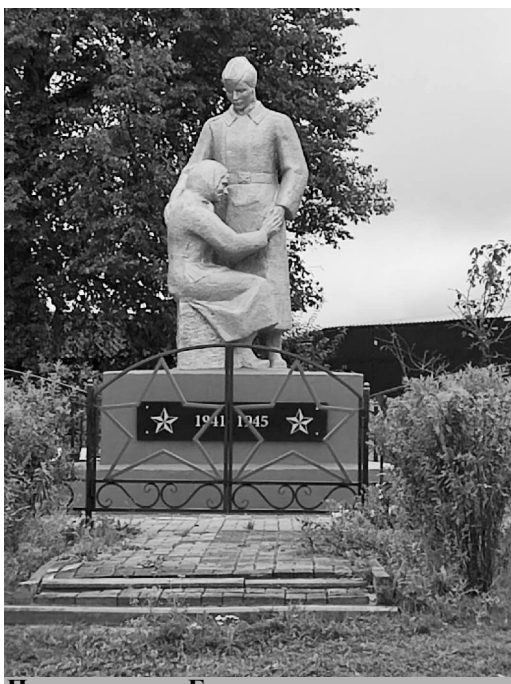
Памятник в с. Бояновичи.

Инициативное бюджетирование - это форма непосредственного участия населения в осуществлении местного самоуправления путём выдвижения инициатив по целям расходования определённой части бюджетных средств. Это официальная формулировка. По факту же, именно жители