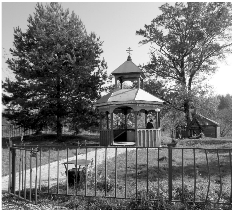
Святой источник в Стайках.

Побывали и на святом источнике, расположенном недалеко от деревни. Особенно здесь многолюдно в летние жаркие дни, на Крещение зимой. Местное население следит как за самим святым источником, так и за территорией вокруг него. Благодаря заботе жителей здесь всегда сохраняется порядок и чистота. Святой источник, значит, и место святое. Присядешь на лавочку, забудешься на мгновение в каких-то своих мыслях. Вокруг простор и такая тишина, что вся обыденная жизнь покажется суетой... В 2019 году святой источник был отремонтирован. И с тех пор вода и купель - неизменные атрибуты деревни Стайки.