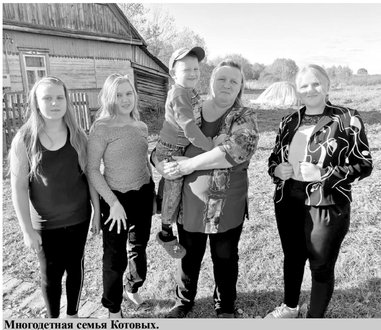
Многодетная семья Котовых.