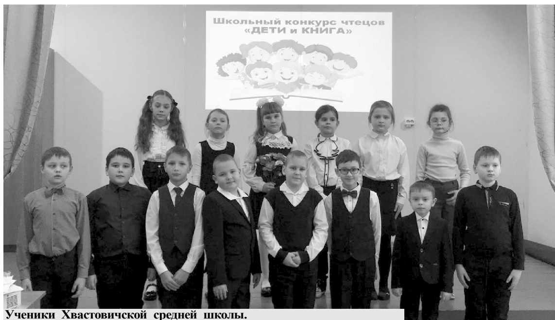
Ученики Хвастовичской средней школы.