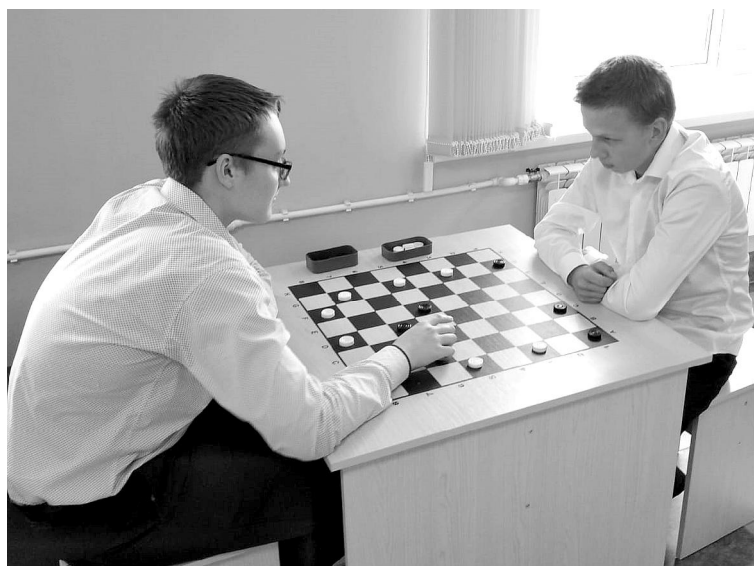
Теребенская средняя школа. Пространство "Точки роста".

■ В начале года начались проверки школьного питания депутатами всех уровней. В школах Хвастовичского района они также проводились. Более того, с участием родительского контроля.