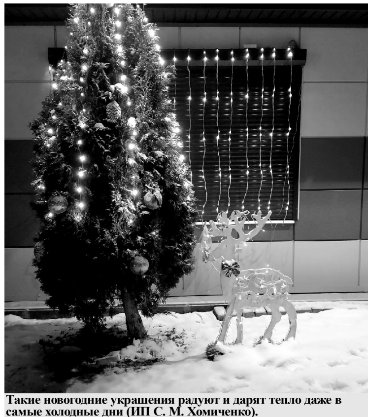
Такие новогодние украшения радуют и дарят тепло даже в самые холодные дни (ИП С. М. Хомиченко).

■ Колесили по сельским поселениям и мы - побывали в Подбужье, Бояновичах, Кудрявце, Милееве, Слободе, Воткине, Стайках, Авдеевке, Пеневицах. И обязательно приедем туда, где не были. И