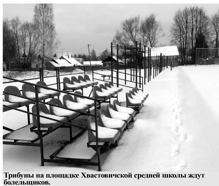
Трибуны на площадке Хвастовичской средней школы ждут болельщиков.