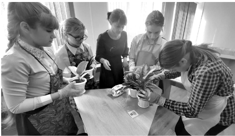
Урок технологии в Бояновичской средней школе.

В меморандуме предлагается использовать современные инструменты воспитания. Такие, например, как цифровизация. Поскольку сейчас дети из дворов и школьных коридоров всё чаще уходят общаться со сверстниками в социальные сети, педагогам важно взять эту ситуа-