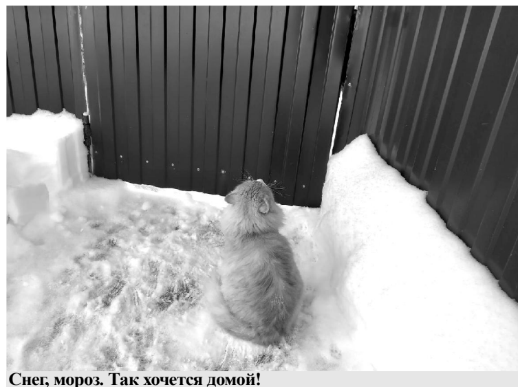
Снег, мороз. Так хочется домой!

Наталья АНДРОСОВА. Фото из архива газеты.