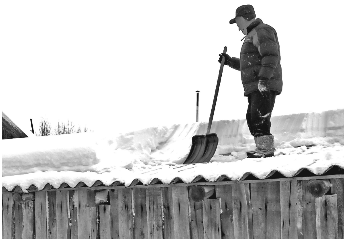
Очищать от снега крыши домов и сараев после снегопадов - необходимо, чем и занимаются хвостовичане.