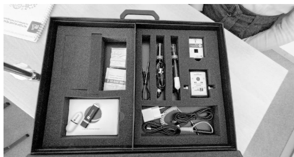
Секреты "чёрных чемоданчиков".