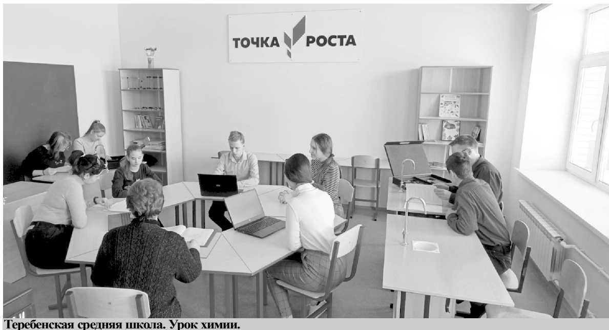
Теребенская средняя школа. Урок химии.

Подготовили Ольга ПОМОЗИНА и Юлия КУЛАБУХОВА, ведущий эксперт отдела образования администрации МР "Хвастовичский район".