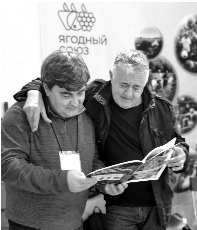
На выставке "Юг Агро", г. Краснодар, 2021 год.

- Мы это и доказываем, более 20 тонн ягод вырастили в 2021 году. А что вообще такое ягоды? Это витамины. То, что мы не можем потребить из других продуктов. По медицинским заключениям, мини-