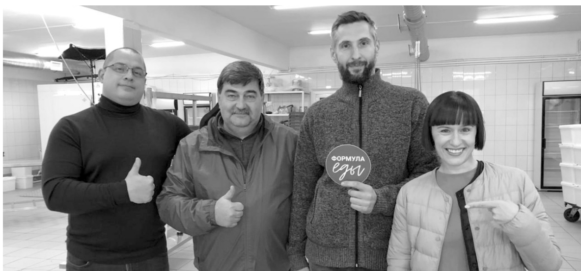
Съёмочная группа программы "Формула Еды" в гостях у ягодников. Канал "Россия 1", октябрь, 2021 год.

- Получается, что Вы рассказали огромной России о небольшом селе Слободе в Хвастовичском районе Калужской области, где трудится команда энтузиастов, которая выращивает ягоду исключительно в соответствии с принципами