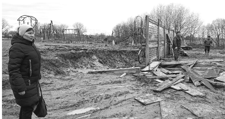
Строительство Дома культуры в селе - сегодня одна из приоритетных задач. И Надежда Афанасьевна контролирует её выполнение.