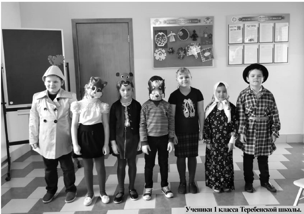
Ученики 1 класса Теребенской школы.

Учащиеся и подколлектив МКОУ „Теребенская средняя школа“ устроили в школе настоящий театральный праздник.