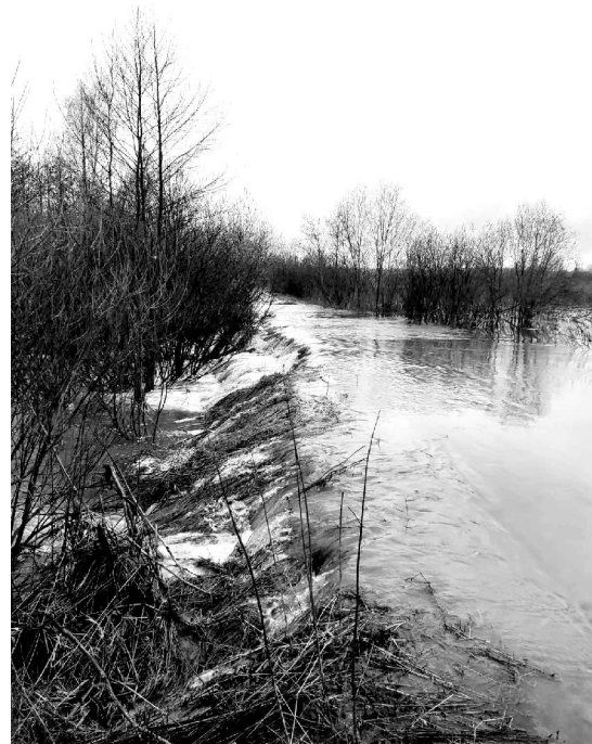
СП "Деревня Авдеевка", дорога до с. Гуда. Фото сделано 21.04.2022 г.

А вот на ГТС на реке Катагоща в Пеневичах ситуация более или менее стабильная. Да, конечно, уровень воды поднялся, но опасности нет. Жители Пеневичей с пониманием относятся к