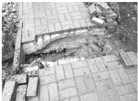
Тротуар по улице Кирова, напротив школы. Фото сделано 20.04.2022 г.

сельской администрации, МУП "Хвастовичское КХ" и отдела ГО и ЧС удалось избежать.