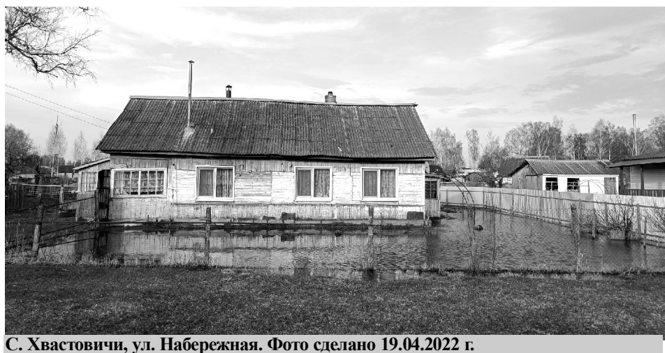
С. Хвастовичи, ул. Набережная. Фото сделано 19.04.2022 г.