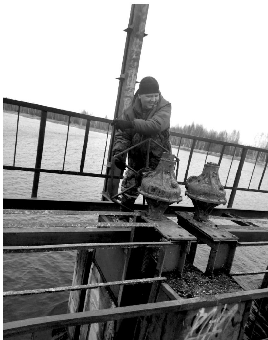
Мероприятие по сбросу воды на ГТС с. Хвастовичи.

тельным улицам действовать пришлось быстро, чтобы избежать неприятных последствий, или же устранить их как можно