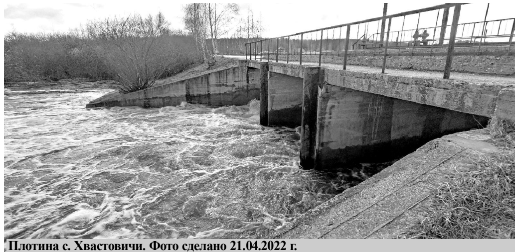
Плотина с. Хвастовичи. Фото сделано 21.04.2022 г.